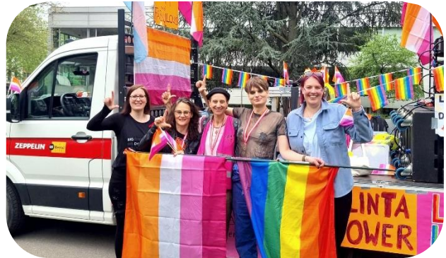
April 2025: Wir beteiligen uns am Aktionsmonat OPEN DYKES