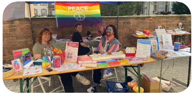
13.09.2025: Infostand zum Tag der offenen Tür