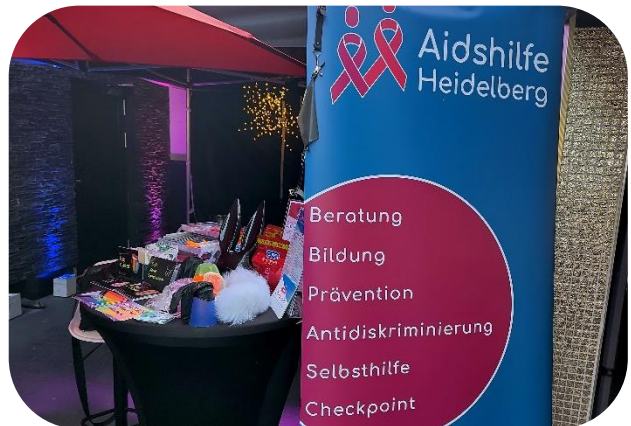
18.06.2025: Infostand bei Kinky Escapes