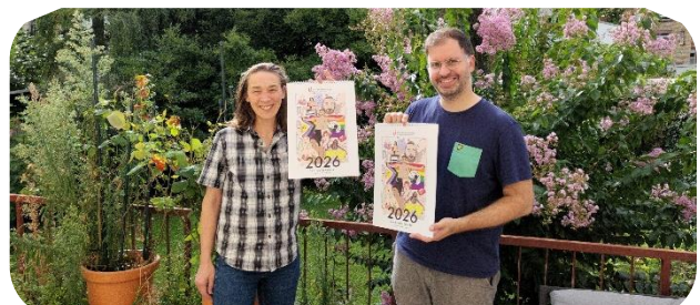
Herbst 2025: Charity-Kalender von Konfettikrake