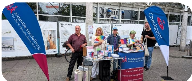
04.09.2025: Infostand zum Welttag der sexuellen Gesundheit