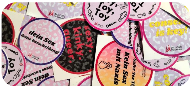
2025 gab es neue Sticker

➤ www.aidshilfe-heidelberg.de/newsletter